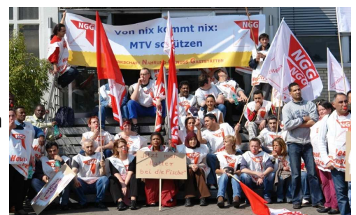
Mit vielen neuen NGG-Mitgliedern und Aktiven gelang es 2006, den MTV zu verteidigen.